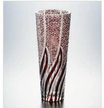
フラワーベース大 TD120×BD80×H300mm