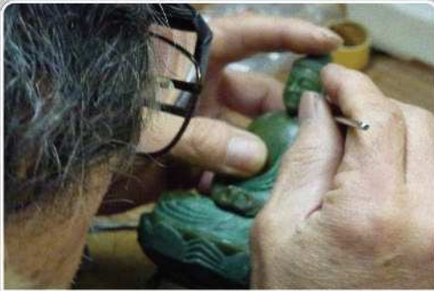
マスターモデル製作: 岡島 延峰先生