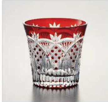
ミニオールドグラス TD72×BD53×H70mm