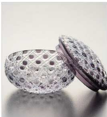
キャニスター TD100×H74mm BD85×H56mm