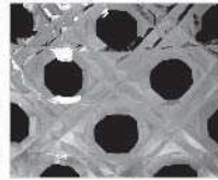
ろっかくかごめから 六角籠目柄