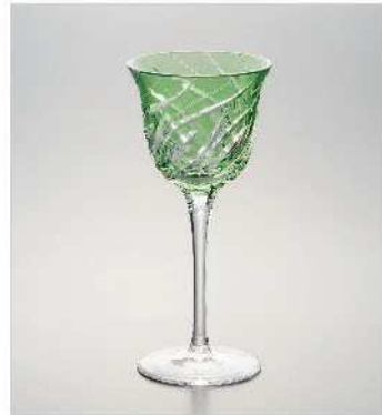
シャンパングラス TD60×BD70×H175mm