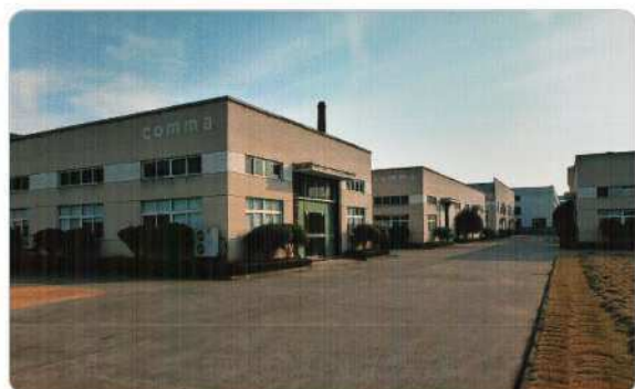
COMMA GLASS LTD. 工場全景