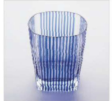
角オールドグラス TD80×BD60×H90mm